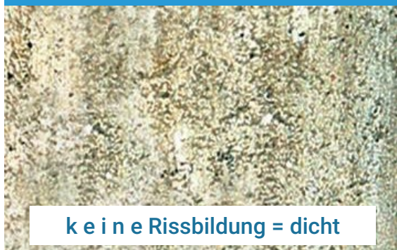
DERNOTON®-Fertigmischung nach Austrocknung

Für diese DERNOTON®-Fertigmischung ergeben sich speziell auch in den Bereichen Anwendungsmöglichkeiten, wo bisher Folien, Beton, Bitumen o.ä. nicht umweltgemäße Abdichtungsmethoden verwendet werden mussten. Von den Straßenbaubehörden wird z.B. bei Regenwassersammelanlagen aus dem Straßenbereich eine permanente Dichtigkeit gefordert, damit auch nach längeren Trockenzeiten der Grundwasserschutz, selbst nach Unfällen mit umweltschädlichen Stoffen, gegeben ist.